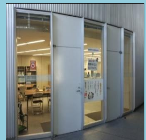
教育開発支援機構

1週間前までに窓口でテキストを取りに来ない場合、 「申し込み」は取り消し となります。